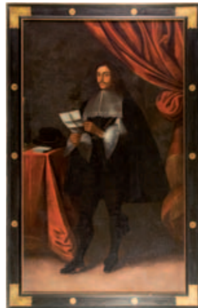
Portrait de Pierre Gardin de la Gerberie, premier maire de Rennes de 1693 à 1695. Huile sur toile, seconde moitié du 17 e siècle. Collection musée de Bretagne