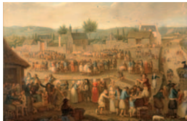
Champ de foire à Quimper d'Olivier Perrin, vers 1820. Collection musée des beaux-arts de Quimper