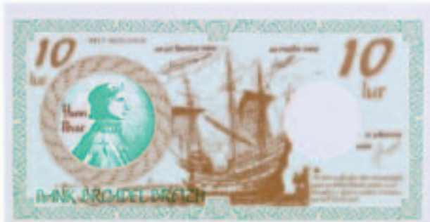
Lurs édités et utilisés pour la fête de la langue bretonne à Spézet de 1992 à 1997. Collection musée de Bretagne.