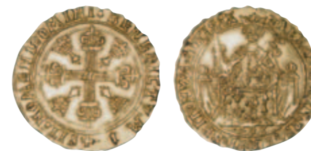
Cadière d'or d'Anne de Bretagne. Collection musée de Bretagne