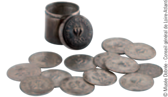
Le treizain de mariage - 17 e siècle. Collection musée Dobrée, Nantes