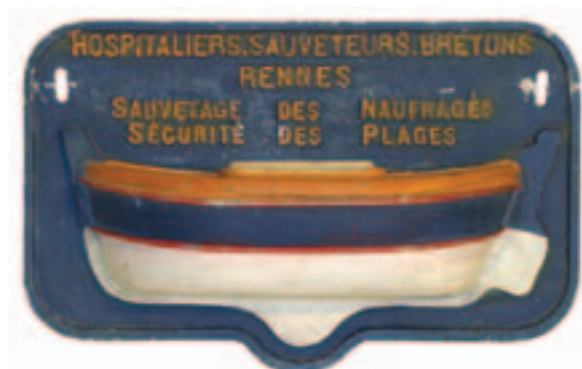
Tronc des hospitaliers sauveteurs bretons (1893-1967).