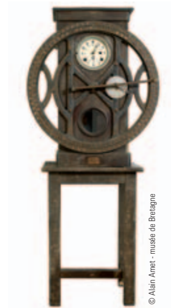
Horloge pointeuse. Collection musée d'art et d'histoire de Saint-Brieuc