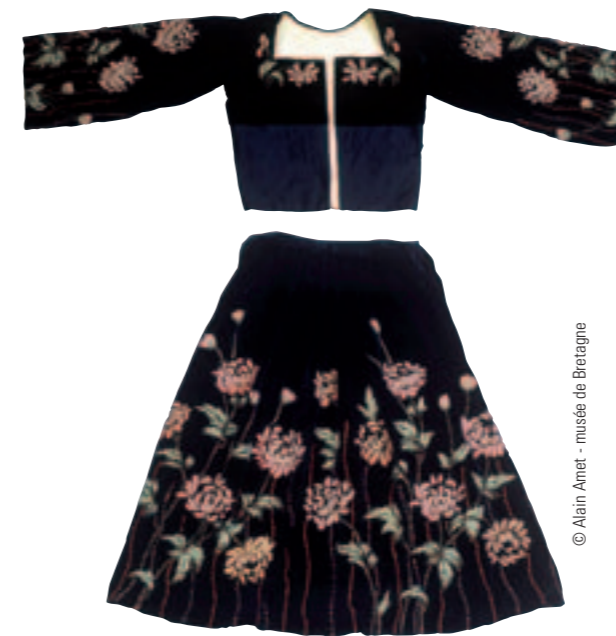
Costume de mariée. Collection musée de Bretagne