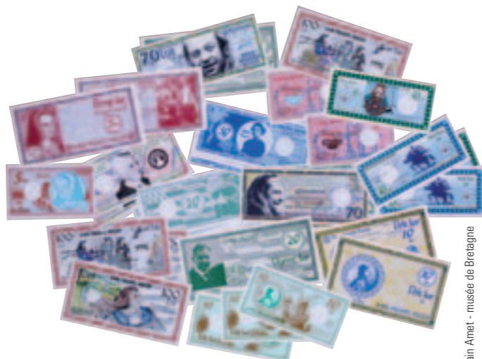
© Alain Amet - musée de Bretagne

L'argent est aussi un moyen de propagande. L'exposition décrypte l'iconographie et les messages utilisés sur les pièces et les billets. Comme