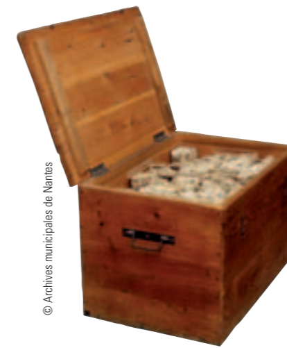
Coffre d'assignats - Nantes - 1797. Collection archives municipales de Nantes