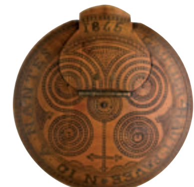
Tabatière. Collection musée de Bretagne