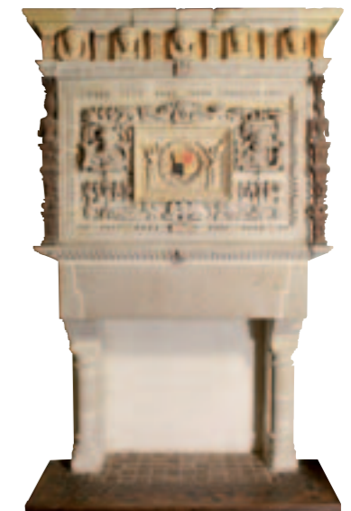
La cheminée de Lucas Royer - 1583. Collection musée du Château, Vitré