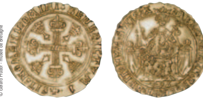
Cadière d'or d'Anne de Bretagne. Collection musée de Bretagne