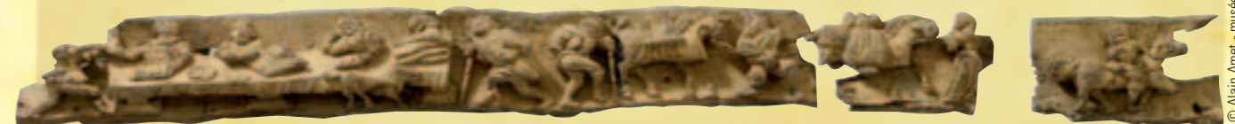
© Alain Amet - musée de Bretagne

Ce tableau profane témoigne des relations complexes nouées entre l'Église et les marchands. En Bretagne, le discours moralisateur de l'institution religieuse savait s'accommoder de la générosité de ses fidèles enrichis par le négoce.