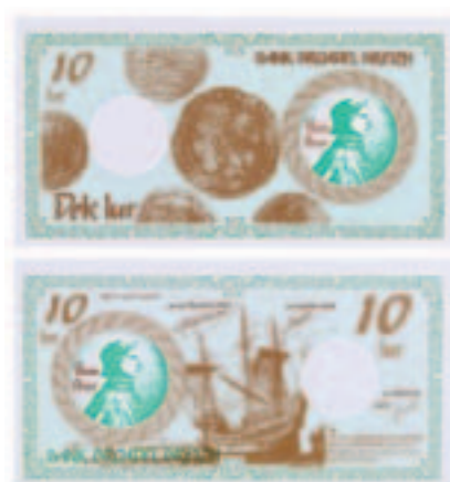
Lurs édités et utilisés pour la fête de la langue bretonne à Spézet de 1992 à 1997. Collection musée de Bretagne.