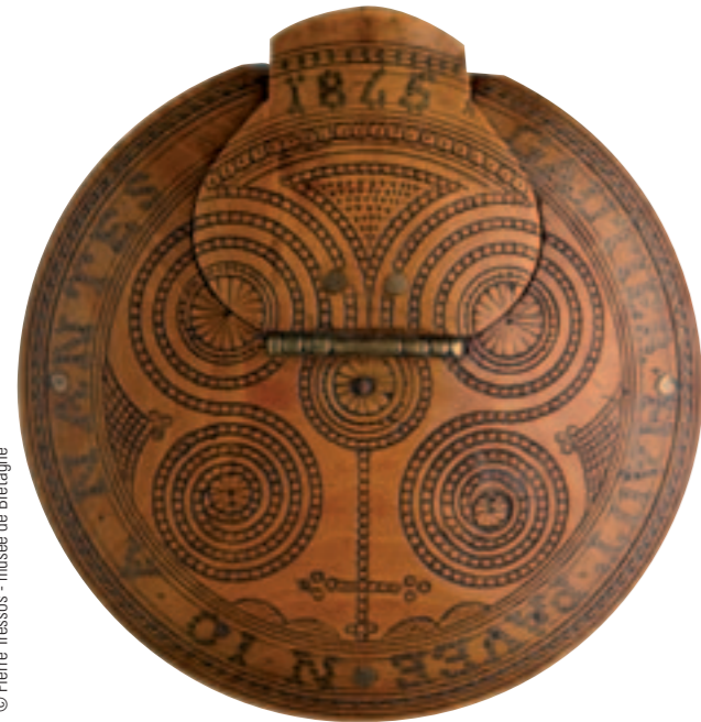
Tabatière. Collection musée de Bretagne