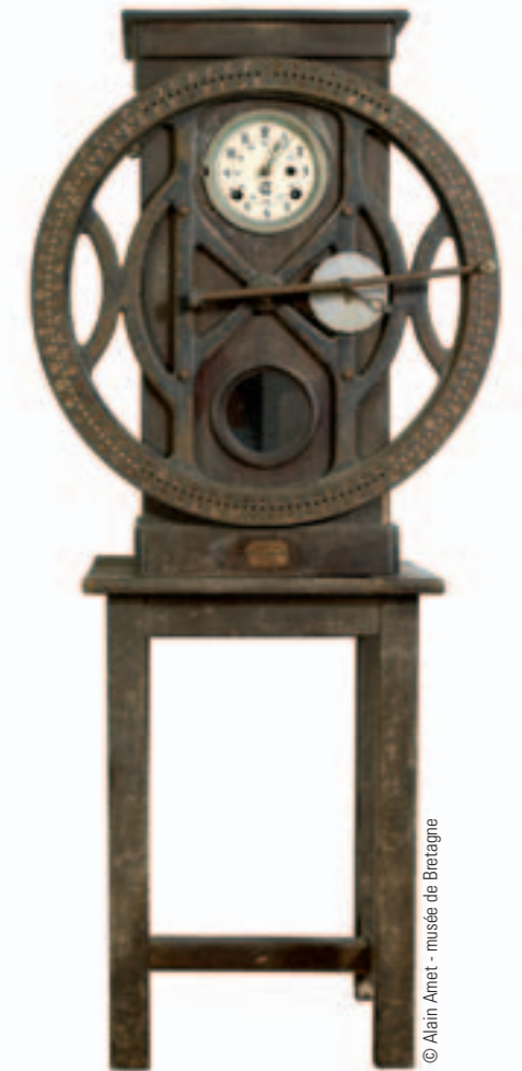
Horloge pointeuse. Collection musée d'art et d'histoire de Saint-Brieuc

Réalisée avec l'appui scientifique des historiens de l'université de Rennes 2, Philippe Hamon en particulier, Les Bretons et l'argent met en valeur une partie des collections et des réserves du musée de Bretagne. Elle met également à l'honneur des pièces prêtées par d'autres institutions bretonnes, dont le musée d'art et d'histoire de Saint-Brieuc, le musée des beaux-arts de Quimper, le musée Dobrée (Nantes), les évêchés de Saint-Brieuc et de Quimper.