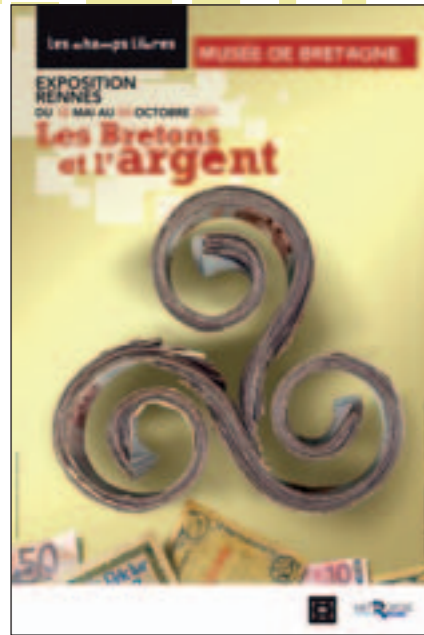
Affiche de l'exposition