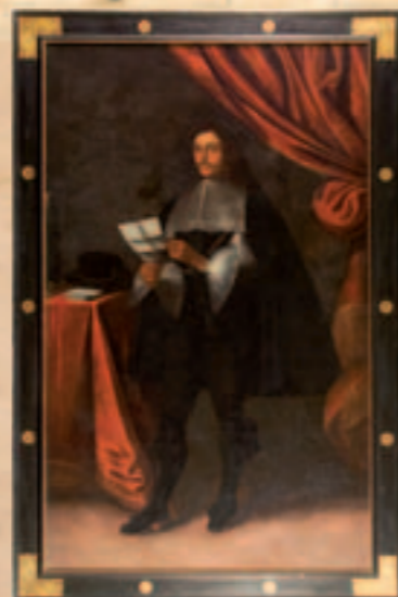
© Alain Amet - musée de Bretagne

Acquis en 2005 par le musée de Bretagne, le tableau est présenté pour la première fois dans une exposition.