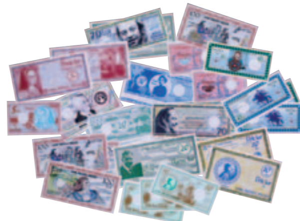
Billets en Lur, utilisés comme monnaie "officielle" pendant la fête de la langue bretonne à Spézet. Collection musée de Bretagne