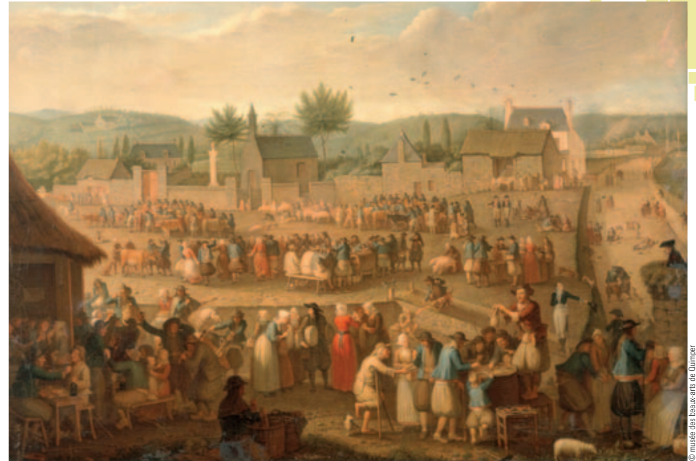
Champ de foire à Quimper d'Olivier Perrin, vers 1820. Collection musée des beaux-arts de Quimper.

En éclairant le présent par le passé, l'exposition met en lumière les comportements individuels et les pratiques collectives des Bretons à l'égard de l'argent. Elle rapporte comment s'est construite l'économie bretonne grâce au commerce. Elle souligne la place de l'argent au travail, en famille ou en société. Elle rappelle comment le pouvoir politique a assis sa domination en battant monnaie, en collectant l'impôt et comment celui de l'Église a pu compter sur un discours moralisateur contre l'avarice mais aussi sur la générosité des fidèles.