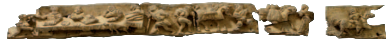
Sablère sculptée - 16 e siècle. Collection archives diocésaines de Quimper et Léon