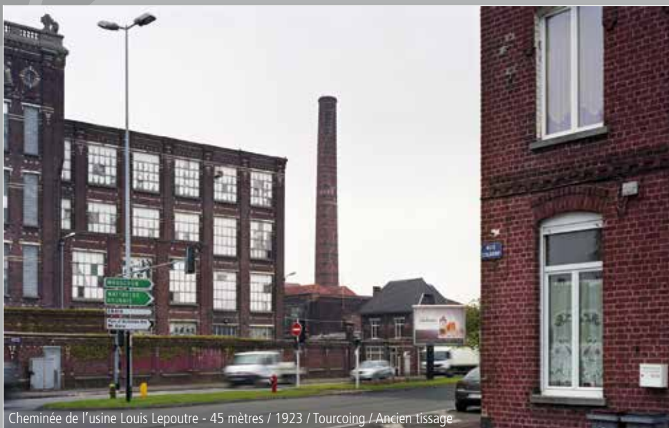
Cheminée de l'usine Louis Lepoutre - 45 mètres / 1923 / Tourcoing / Ancien tissage

du mercredi au dimanche : de 13h30 à 18h30