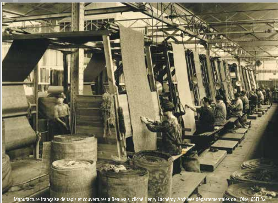
Manufacture française de tapis et couvertures à Beauvais